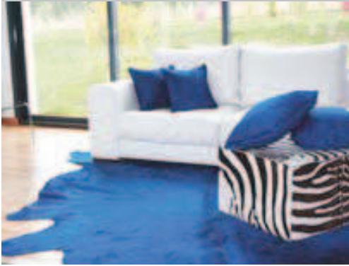
Dans les nouveaux habitats, le tapis peut jouer un rôle majeur dans la délimitation de l'espace.

Choisir son tapis selon son intérieur est souvent un parcours du combattant. Formes, couleurs, matières, tailles, prix, etc. Comment s'y retrouver ? La réponse avec nos conseils pour bien choisir et ainsi éviter de mettre votre porte-monnaie au tapis !